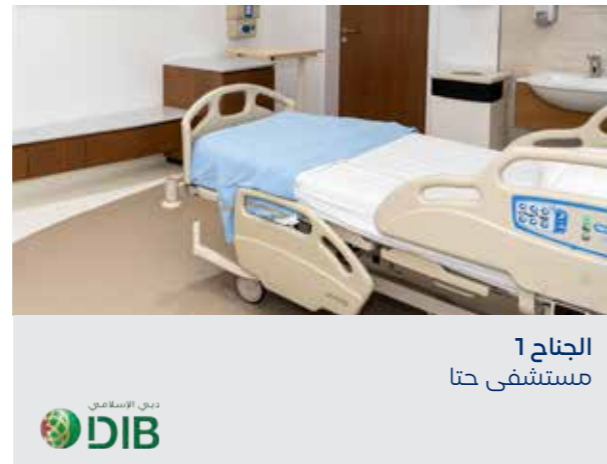
الجناح 1 مستشفى حتا