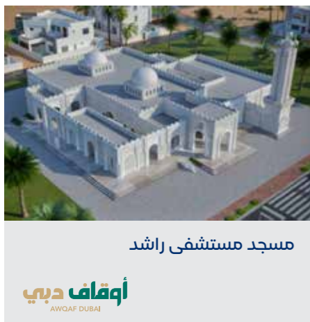
مسجد مستشفى راشد