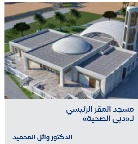
مسجد المقر الرئيسي لـ«دبي الصحية»