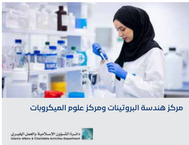
مركز هندسة البروتينات ومركز علوم الميكروبات