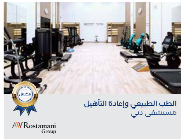
الطب الطبيعي وإعادة التأهيل مستشفى دبي