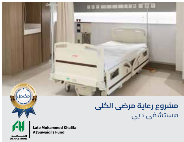
مشروع رعاية مرضى الكلى مستشفى دبي

مشروعاً لتطوير مرافق «دبي الصحية» من خلال صندوق الأمل