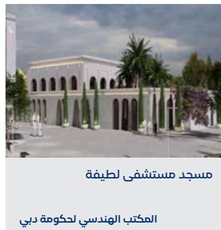
مسجد مستشفى لطيفة