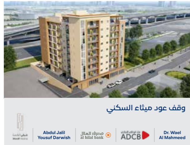
وقف عود ميثاء السكني