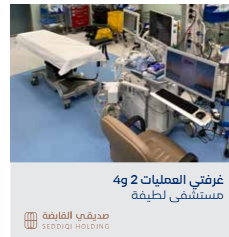
غرفتي العمليات 2 و4 مستشفى لطيفة