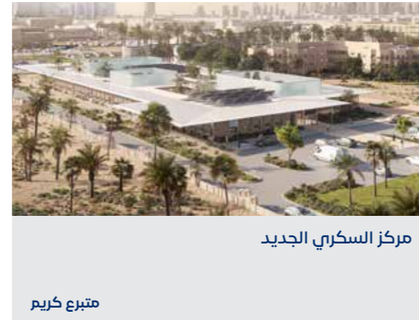
مركز السكري الجديد