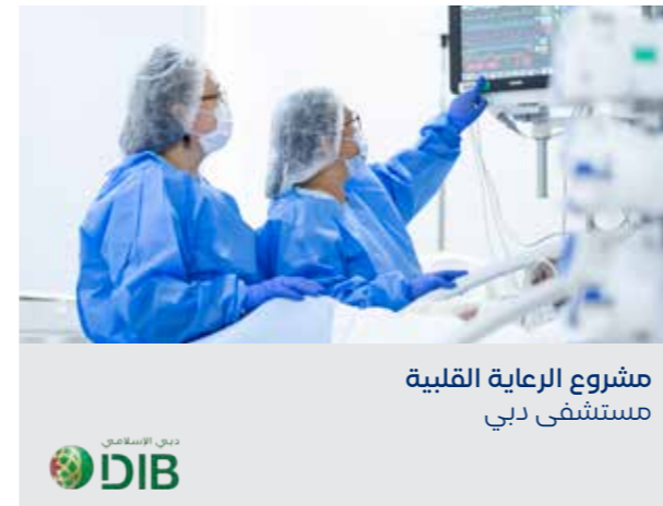
مشروع الرعاية القلبية مستشفى دبي