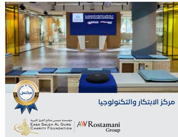
مركز الابتكار والتكنولوجيا