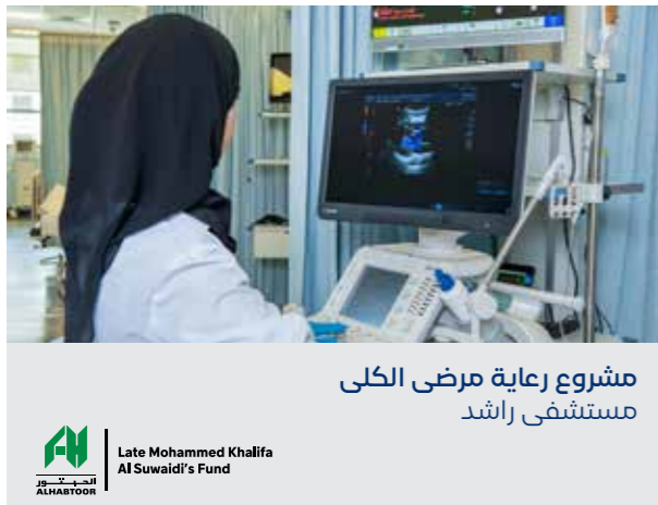
مشروع رعاية مرضى الكلى مستشفى راشد